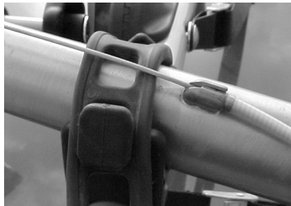
Fig. 4: Wrap rubber straps under cables