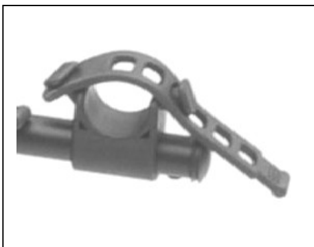
Fig. 3: Bike Cradle